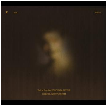
Felix Profos Forcemajeure CD zhdkrecords.zhdk.ch 25/11