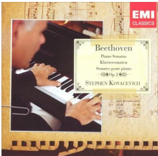
Aufnahme 5: Stephen Kovacevich, Klavier EMI Classics 7243 5 57730 2 9 (2004)