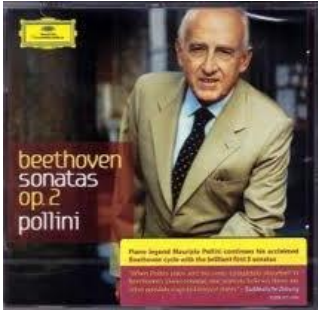
Aufnahme 4: Maurizio Pollini, Klavier Deutsche Grammophon DG 477 6594 (2007)