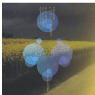
Bänz Oester & the Rainmakers: Playing at the Bird's Eye CD Unit, 4489