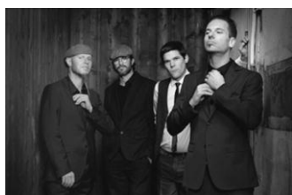
René Mosele's Ramblin': Jelly Roll CD unveröffentlicht