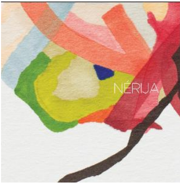
CD: Nérija: Blume Label: Domino Records