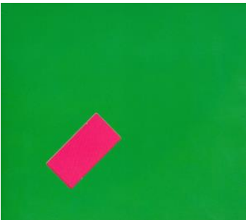
Gil Scott-Heron & Jamie xx: We're New Here Label: XL Recordings

Titel: The Revolution Will Not Be Televised