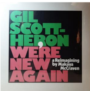
Gil Scott-Heron: We're New Again - a Reimagining by Makaya McCraven Label: XL Recordings