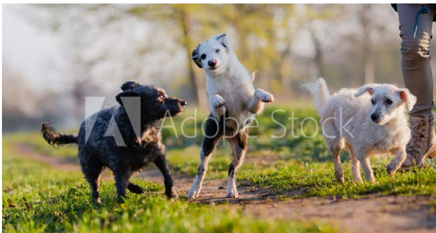
Hunden in der Erziehung zu viele Freiheiten zu geben, kann kontraproduktiv sein.

Zurück an den Anfang, zur Begegnung im Alltag: Wenn auch das Befolgen von Kommandos für den Laien beeindruckend sein mag, so geht der «Erziehungspreis» an die Frau. Warum? Ihre Hunde entschieden sich quasi frei für das erwünschte Verhalten, sie hatten dabei die Wahl. Der Hund des Mannes hingegen hatte keine Wahl. Wie er sich verhalten hätte, wenn er nicht unter Kommando gestellt gewesen wäre, bleibt dahingestellt.