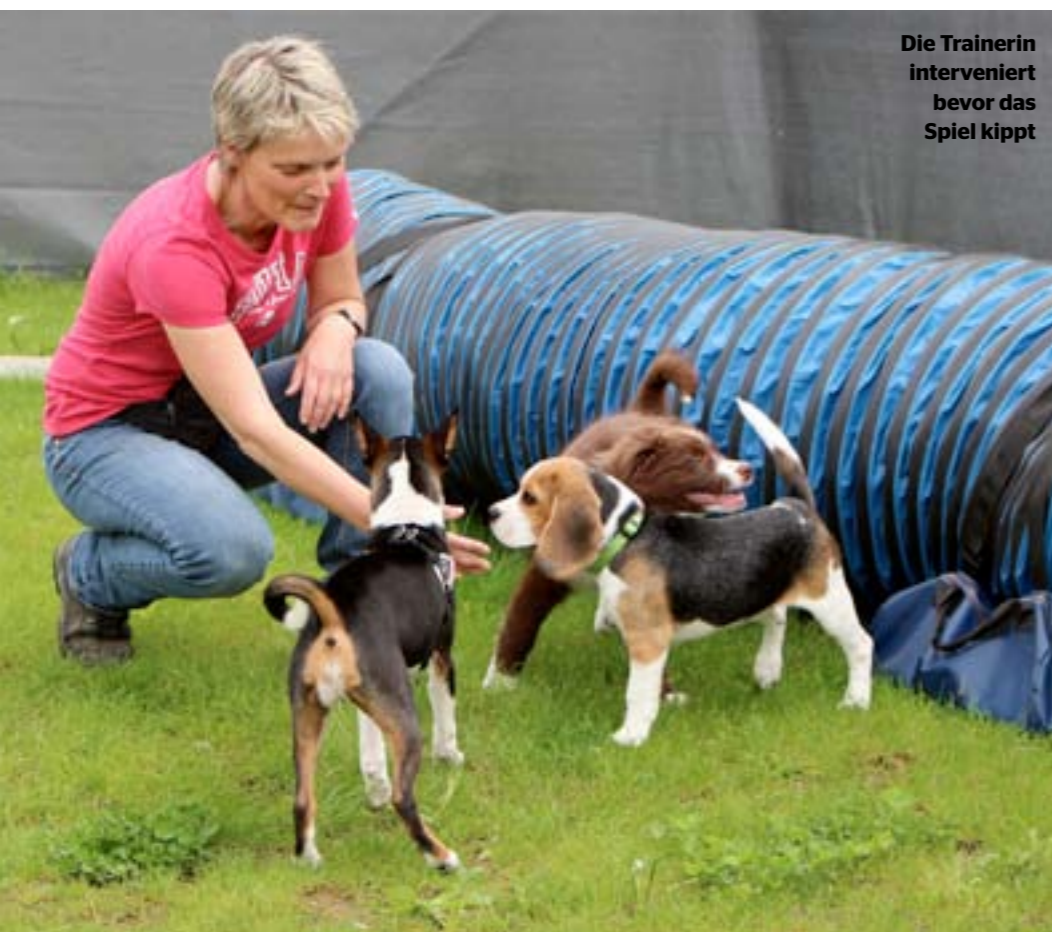
Die Trainerin interveniert bevor das Spiel kippt

wurde durch die Domestikation und dessen Evolution der Mensch. Das untermauern die Resultate zahlreicher Studien, die in neuerer Zeit gemacht wurden. So zeigt eine Studie der Universität Budapest auf, dass Hundewelpen, die zwischen dem Kontakt zu einem fremden Menschen oder zu einem fremden Hund wählen konnten, sich für den Menschen entschieden. Dagegen wählten Wolfswelpen in der gleichen Situation den Kontakt zum fremden Hund. Die Wissenschaft spricht von einer Domestizierung vor 15 000 und mehr Jahren. In einer solchen Zeitspanne des Zusammenlebens müssen Hund und Mensch einander nähergekommen sein. Und dabei muss ja einiges passiert sein. Der Hund sei kein Wolf mehr, vor allem sei er kein „verdummerter Wolf“, sagt die deutsche Forscherin Juliane Kaminski. Er habe neue und flexible Fähigkeiten entwickelt, die ihn perfekt ans Leben mit dem Menschen anpassen würden. Da sind die physiologischen Anpassungen (vom Fleisch- zum Allesfresser), züchterische Eingriffe aber auch die Kommunikations- sowie empathischen Fähigkeiten, die der Hund entwickelt hat. So liegt es in dessen Natur, dass er seinen Menschen liebt und ihn als den wichtigsten Sozialkontakt betrachtet. Nur sind sich das noch nicht alle Hundehalter richtig bewusst geworden. ▶