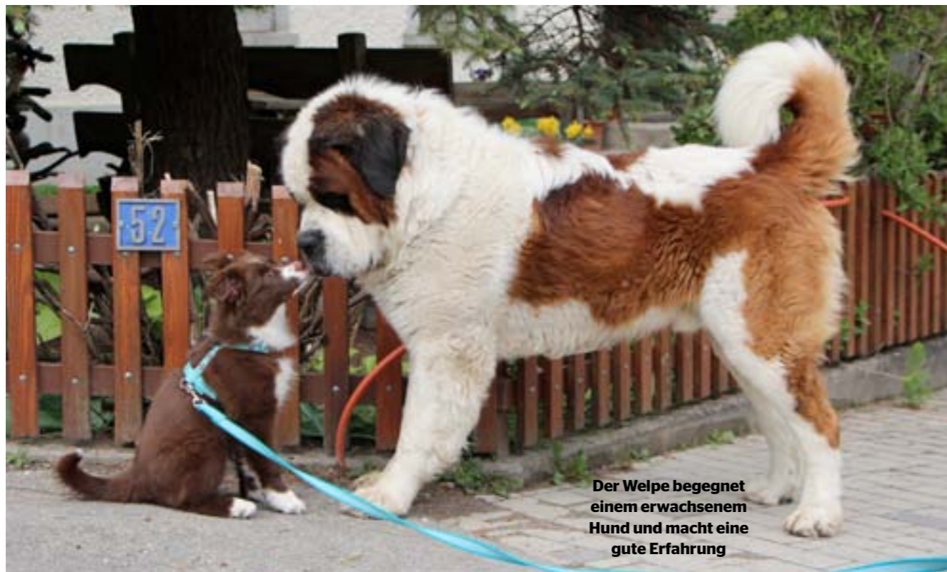
Der Welpe begegnet einem erwachsenem Hund und macht eine gute Erfahrung