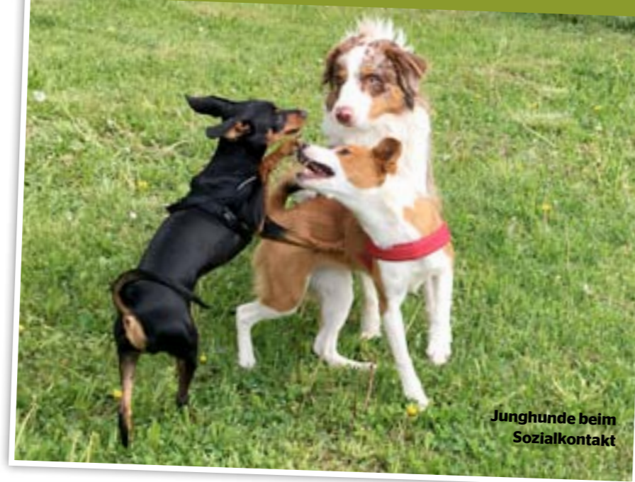
Junghunde beim Sozialkontakt

Der Mensch als Kontakt-Verderber Hunde nehmen sich zuerst auf Distanz über Sicht und Gerüche wahr, lange bevor es zu einem Kontakt kommt. Mancher Hund würde sodann einem Artgenossen lieber aus dem Wege gehen, doch der Mensch hindert ihn da-