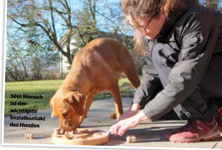
Sein Mensch ist der wichtigste Sozialkontakt des Hundes

Sozialkontakt erlebt der Hund bereits im Leib der Mutterhündin und danach im Wurf, im „Familienrudel“, wo erste soziale Fertigkeiten trainiert werden. Dort findet ein wichtiger Teil der Sozialisierung statt. Wird ein Welpe zu früh aus